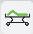
Fußteil 0 – 45°