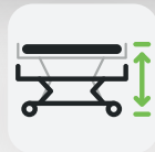
Höhe 110 – 800 mm